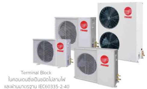
Terminal Block ใบคอนเดนซิ่งเป็นชนิดไม่ลามไฟ และผ่านมาตรฐาน IEC60335-2-40

พร้อมด้วย Condensing Unit ที่มีมาตรฐานการทำงานสูง รับประกันคุณภาพคอมเพรสเซอร์ นานถึง 7 ปี